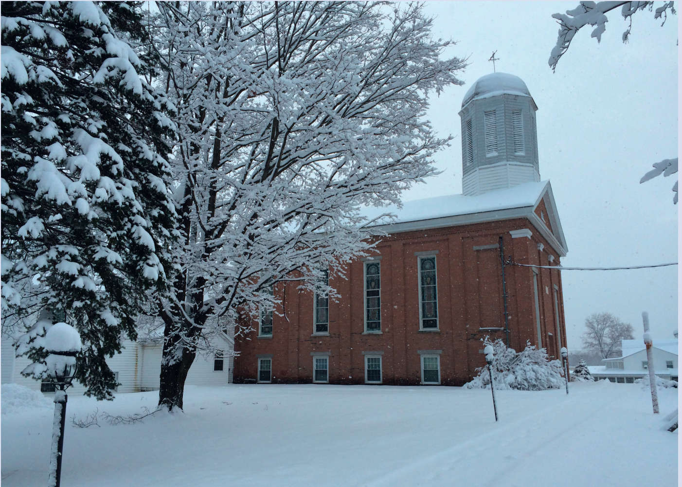
Lisa's Kill Reformed Church in Colonie, Bundesstaat New York, USA

dikal alle einbeziehenden Liebe Christi, die weniger auf einer strikten Befolgung von Regeln als vielmehr auf der Gnade beruht. Diese Kluft zwischen strikter Befolgung und radikalem Einbezug ist wahrscheinlich die grösste Herausforderung, die die US-amerikanischen Kirchen heute zu bewältigen haben. Wegen solcher Fragen kommt es zu Kirchenspaltungen, und zudem sind – vor allem unter jungen Menschen – nachlassende Beteiligung und sinkende Mitgliederzahlen festzustellen. Dort, wo man die Kirche als richtend, heuchlerisch und intolerant wahrnimmt, wird kirchliches Zeugnis ganz erheblich erschwert.