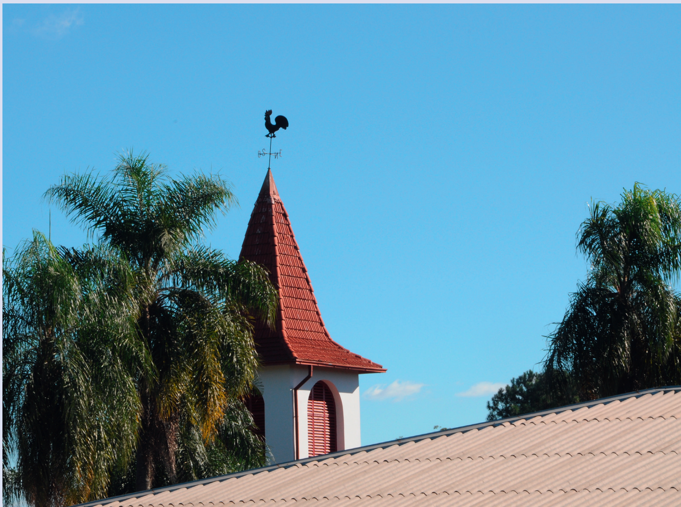
Iglesia Evangélica Suiza, Ruiz de Montoya, Argentinien

sich die Minderheitskirchen, die aus der Reformation stammen. Für manche ihrer Mitglieder, insbesondere in der Stadt, hat jedoch der christliche Glaube die gestaltende Kraft verloren. Die daraus folgende Abnahme der Mitglieder wirkt sich auch auf die Finanzen der Kirchen aus. Missionarische Bestrebungen, sowohl die ethnisch-konfessionell geprägte Mitgliedschaft zu erhalten als auch neue Mitglieder hinzuzugewinnen, haben bisher noch keine nennenswerten Früchte gezeigt. Trotz des Anwachsens der (Neu-) Pfingstler und der Säkularisierung hält der historische Protestantismus treu am Erbe der Reformation fest. Dazu gehören die Offenheit für den ökumenischen Dialog und das soziale Engagement. Dies drückt sich in institutioneller und politischer Gemeindediakonie, theologischer Ausbildung und Veröffentlichungen aus, die sich gegen gefährliche Entwicklungen in der Gesellschaft wehren. Ist das als reformatorischer Geist anzusehen? Der traditionelle katholische Geist ist überall spürbar; wie stellt man den protestantischen fest?