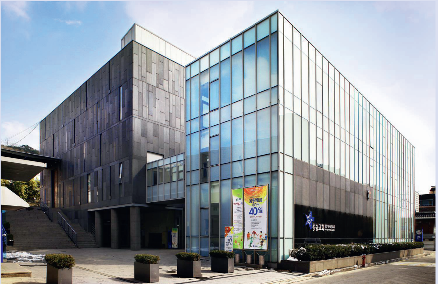
Dongsung-Kirche, Presbyterian Church of Korea, Seoul, Südkorea