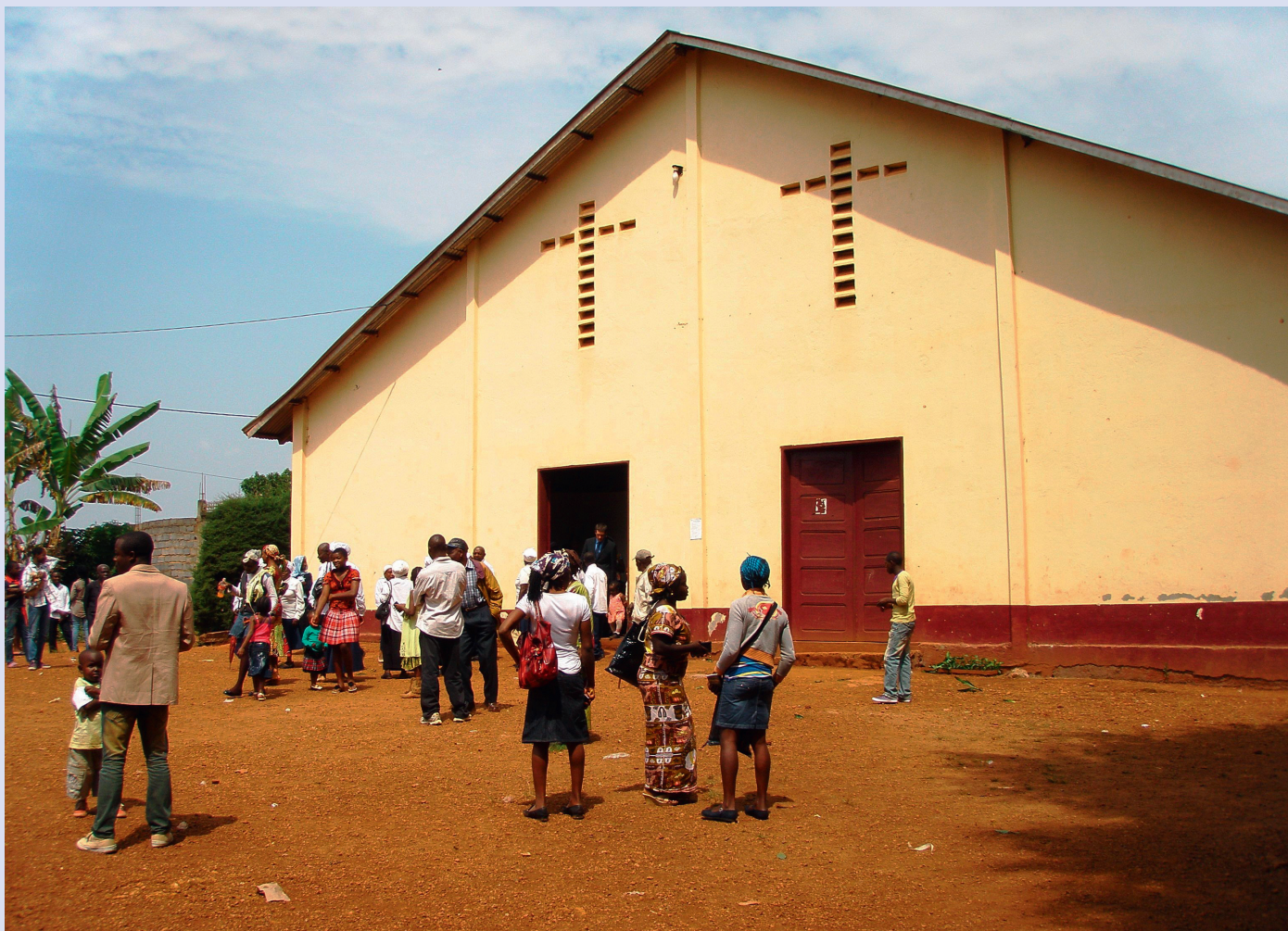
Temple de l'Eglise Evangélique du Cameroun de Ndiangdam à Bafoussam, Cameroun