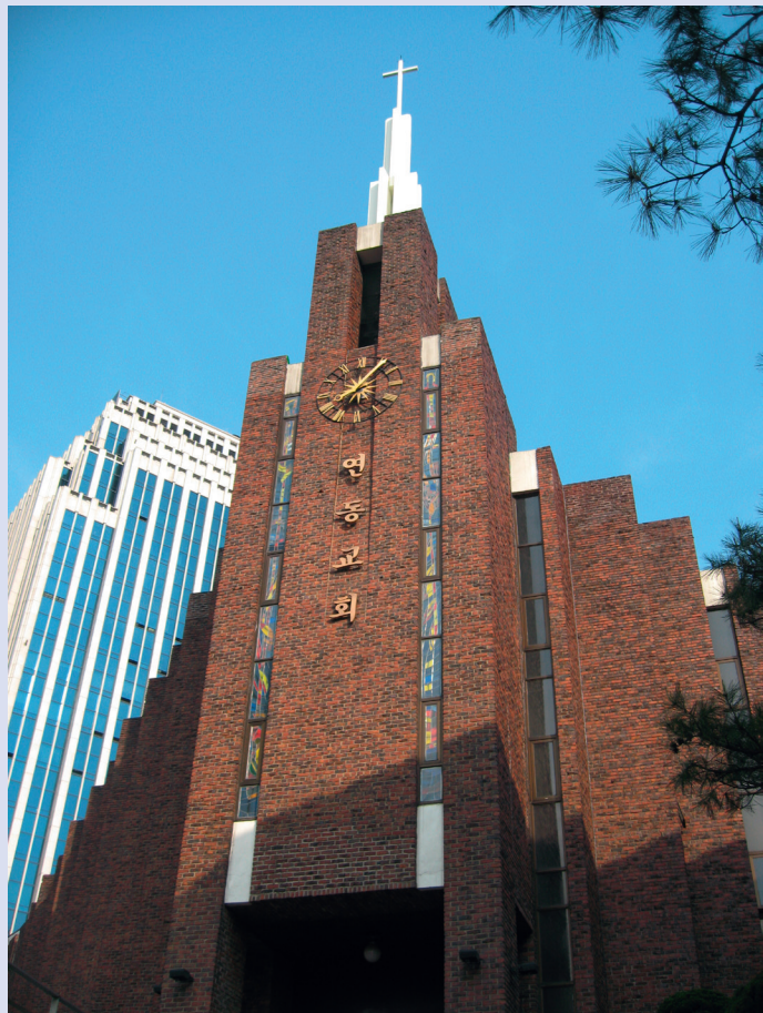
Yeondong-Kirche, Presbyterian Church of Korea, Seoul, Südkorea

Die koreanischen Kirchen betrachteten die Reformation stets als eine Bewegung, die das Wort Gottes ins Zentrum stellte. Nach dem Vorbild Calvins ist das Wort Gottes Wesen und Massstab der Kirche zugleich. Calvin war überzeugt, dass Gottes Wort in der Bibel direkt an die Menschen gerichtet und mit «Gottes absoluter Souveränität» gleichzusetzen ist. Durch letztere ist das Heil für uns Sünder und Sünderinnen präsent und darin steckt gleichzeitig auch das wesentliche Prinzip des