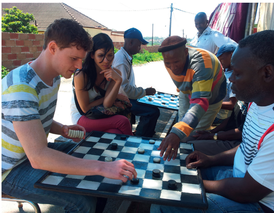
Faire Begegnungen mit Menschen aus anderen Kulturen – unterwegs wie zuhause

Seit über dreissig Jahren hinterfragt der Arbeitskreis tourismus & entwicklung (akte) das weltweite Reisen und den Tourismus aus entwicklungspolitischer Sicht. Die dabei gewonnenen Erkenntnisse sammelt und teilt die Nichtregierungsorganisation (NGO) auf ihrem neugestalteten Webportal www.fairunterwegs.org . Das Ziel: Reisende wie Branche zum verantwortlichen Handeln anzuregen – auf Reisen wie zuhause.