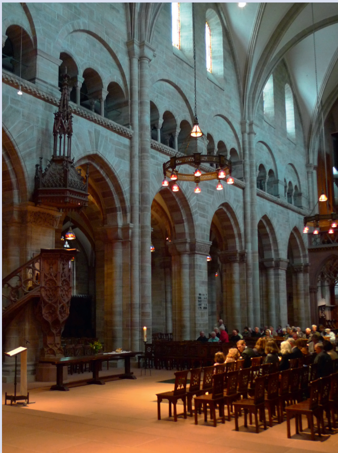
Basler Münster