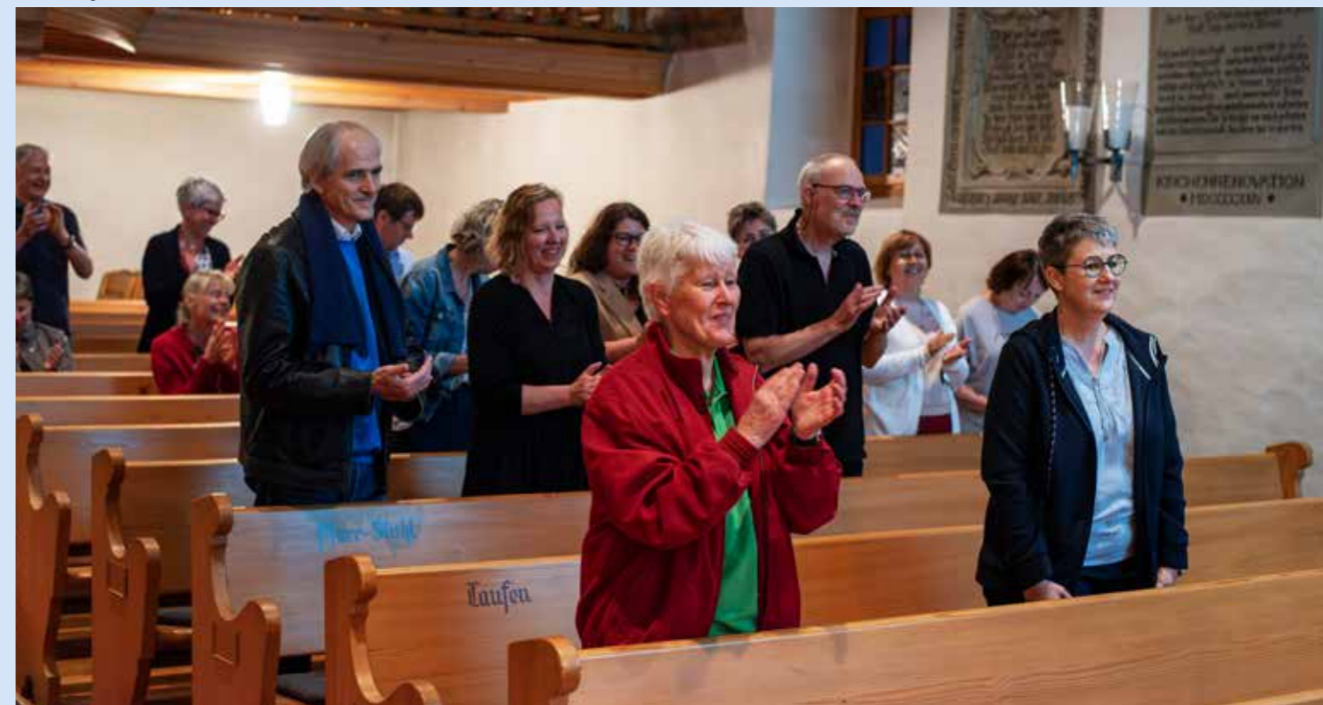
Nuit des églises à Wimmis.